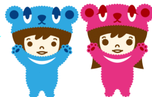
サポステオフィシャルキャラクター